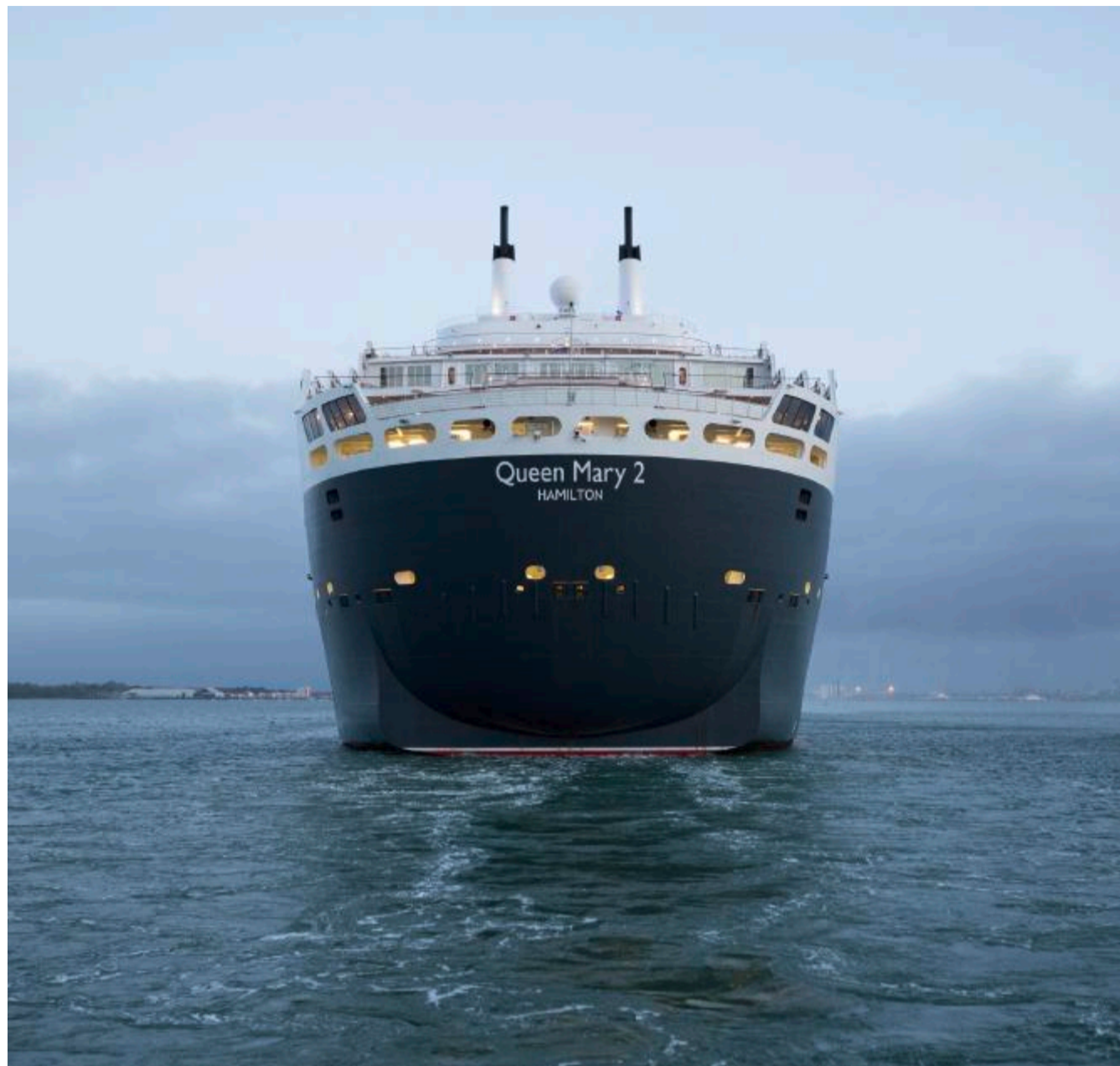
Schwimmende Stahlstadt: Majestätisch gleitet die Queen Mary 2 durch die See.