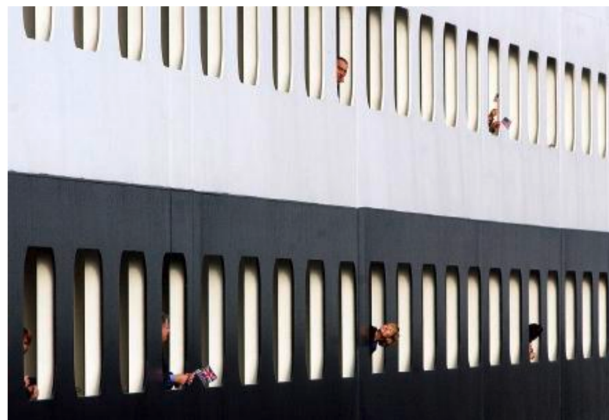
Passagiere bei der Einfahrt in den Hafen von New York.